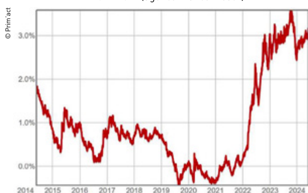
Barème de capitalisation – Figure 1 – Évolution des taux OAT 2014-2024 (agence France Trésor)

Il reste alors à fixer le niveau de ce taux d'actualisation, en tenant compte :